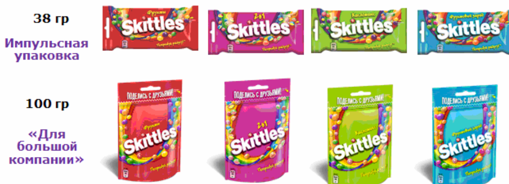
Рис. 2. Портфель жевательных конфет Skittles в России

Жевательные конфеты Skittles появились в России в 2002 году. Они не имеют аналогов на рынке, так как обладают уникальной технологией производства, которую очень сложно повторить. В пачке 5 разных фруктовых вкусов, каждая конфета имеет мягкий центр и твердую глазурь, брендированную буквой «s». Сегодня портфель марки представлен двумя форматами и продается в четырех вкусах (рис. 2):