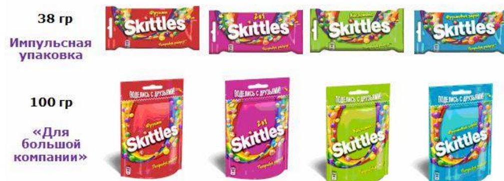
Рис. 2. Портфель жевательных конфет Skittles в России

Жевательные конфеты Skittles появились в России в 2002 году. Они не имеют аналогов на рынке, так как обладают уникальной технологией производства, которую очень сложно повторить. В пачке 5 разных фруктовых вкусов, каждая конфета имеет мягкий центр и твердую глазурь, брендированную буквой «s». Сегодня портфель марки представлен двумя форматами и продается в четырех вкусах (рис. 2):