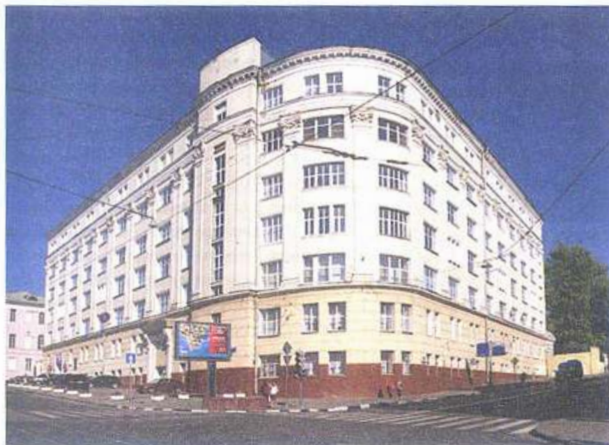
Национальный исследовательский университет «Высшая школа экономики»