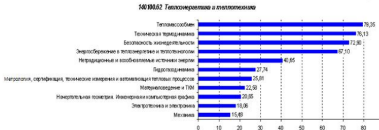
Рисунок 1 – Рейтинг выбранных дисциплин участниками ФИЭБ по направлению подготовки «Теплоэнергетика и теплотехника»

Безусловно, необходим дополнительный анализ причин именно такого рейтинга, поскольку все представленные дисциплины относятся к базовой части профессионального цикла, и, казалось, следовало бы ожидать более равномерного распределения предпочтений. Скорее всего, выбор был предопределен широким перечнем разнообразных объектов деятельности, представленных в ФГОС. Первые три дисциплины являются базовыми для взаимодействия почти со всеми объектами. Двадцать один процент для дисциплины «Начертательная геометрия. Инженерная и компьютерная графика» говорит о недостаточном объеме преподавания этой дисциплины в вузах, несмотря на большую потребность в проектировщиках, владеющих компьютерными технологиями проектирования. Обидное последнее место «Механики» обусловлено, скорее всего, временным расстоянием между экзаменом и временем ее изучения.