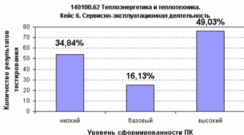
Рисунок 2 – Уровни сформированности компетенций по сервисно-эксплуатационной деятельности

Это несколько удивительный результат. Задачи кейсов по каждому виду деятельности были, по необходимости, объектно-ориентированными. В ФГОС-е в длинный перечень входят весьма разнородные объекты, от установок водородной энергетики до энергоблоков электростанций, и технологии их монтажа, наладки, испытаний, обслуживания существенно разнятся. Хороший результат по монтажно-наладочной и сервисно-эксплуатационной видам профессиональной деятельности связан, скорее