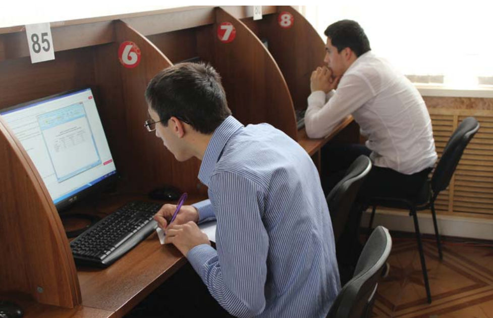
На федеральном интернет-экзамене