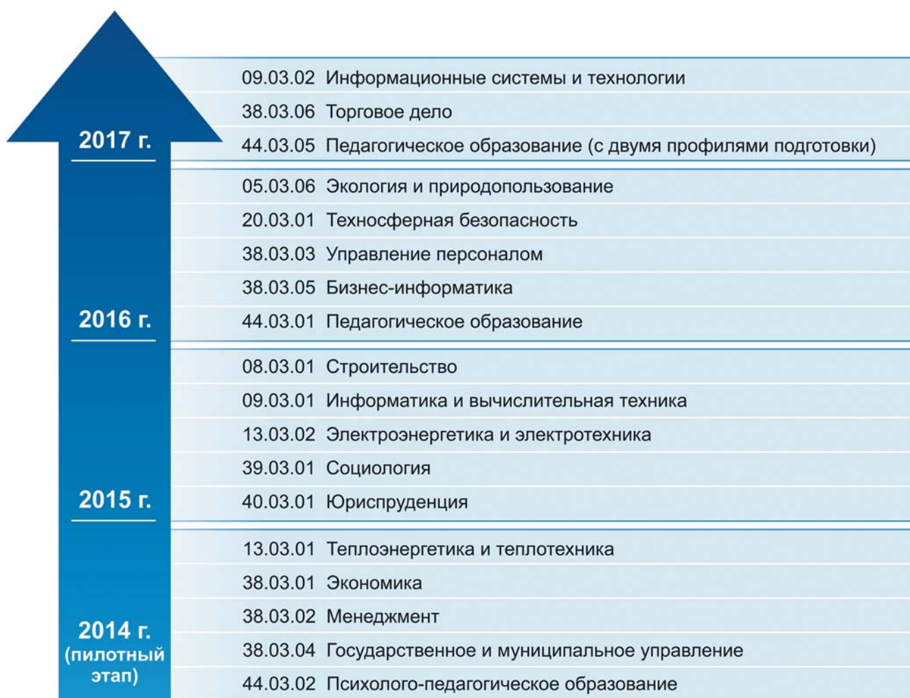
Рис. 5. Увеличение количества направлений подготовки бакалавриата для проведения федерального интернет-экзамена для выпускников бакалавриата с 2014 года

Федеральный интернет-экзамен для выпускников бакалавриата – это инновационный, молодой, динамично развивающийся и востребованный вузами и студентами проект, введение которого в практику внешней независимой оценки качества подготовки выпускников бакалавриата на всей территории Российской Федерации своевременно и отвечает актуальным задачам современного российского образования. О нарастающей популярности федерального интернет-экзамена свидетельствует участие в нем весной 2016 года 5230 студентов из 110 обра-