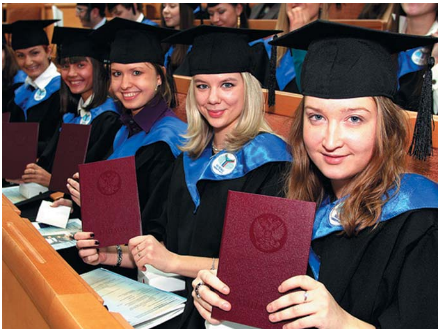
Юные выпускницы бакалавриата, только что получившие диплом

Важным нововведением в организационном обеспечении федерального интернет-экзамена для выпускников бакалавриата-2016 является процедура проверки аудиторий, предназначенных для проведения экзаменационных сеансов на соответствие техническим требованиям. Эта процедура была введена в целях повышения уровня и качества организации интернет-экза-